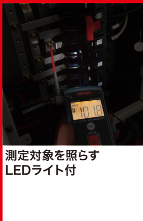
測定対象を照らすLEDライト付