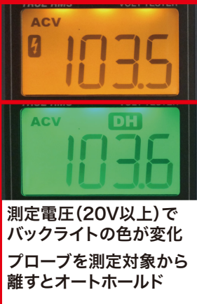
測定電圧(20V以上)でバックライトの色が変化プローブを測定対象から離すとオートホールド