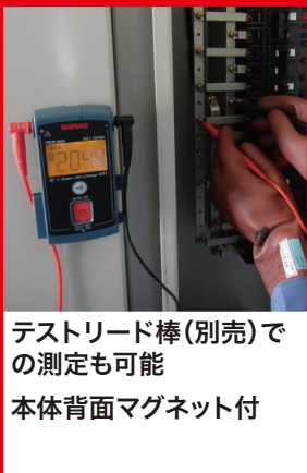
テストリード棒(別売)での測定も可能本体背面マグネット付