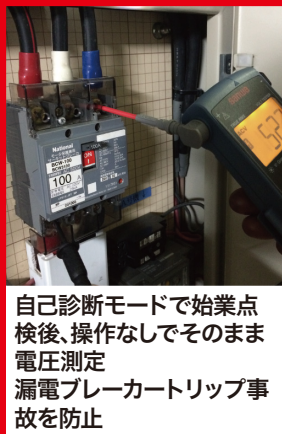
自己診断モードで始業点検後、操作なしでそのまま電圧測定漏電ブレーカトリップ事故を防止