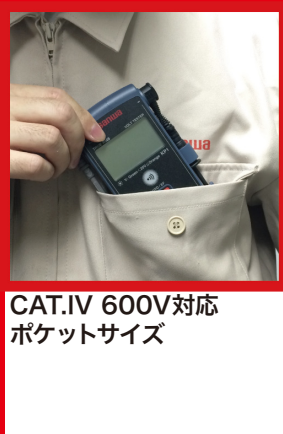
CAT.IV 600V対応ポケットサイズ