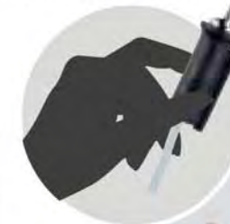
センサホルダに スベリ止め仕様で安心測定