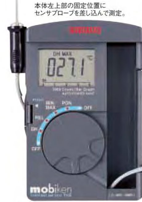
本体左上部の固定位置に センサプローブを差し込んで測定。

ポケットサイズながら高精度、広範囲測定を実現しました。使用後はセンサ部を本器内に収納できる、携帯に便利なスマートな計測器 mobiken シリーズ。